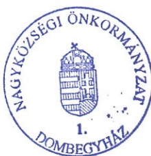
Dr. Varga Lajos polgármester