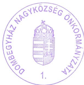
Dr. Varga Lajos polgármester